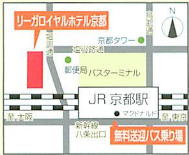
※JR京都駅から徒歩約7分(バスは、約15分間隔で運行)

会場 リーガロイヤルホテル京都 「桔梗の間」2階 (交流会:「堀川の間」・2階) 京都市下京区東堀川通塩小路下ル松明町1番地 TEL.075-341-1121(代)